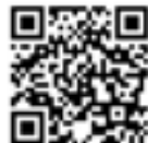
兒少新聞妙捕手網站