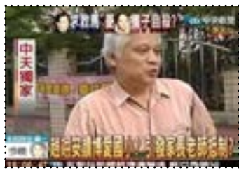
• 以兒童青少年為報導關係人

兒少新聞又可以依報導性質區分成「正面新聞」與「負面新聞」，正面新聞包含兒少的成就、貢獻或孝悌楷模，以及兒少議題的報導，例如：教育、休閒娛樂、健康、安全、次文化、社會參與等。負面新聞則指涉及兒童少年相關法規之個案，例如：遭受虐待、遺棄、性侵、中輟、暴力、死亡及學業問題等報導。