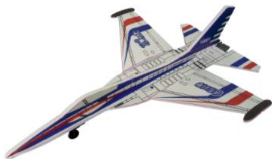
▲ IDF 經國號戰鬥機(充電式電動飛機)